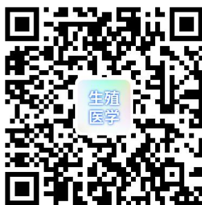
生殖医学年会微官网