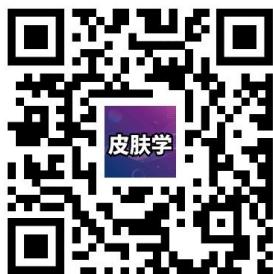
会议征文及报名微官网