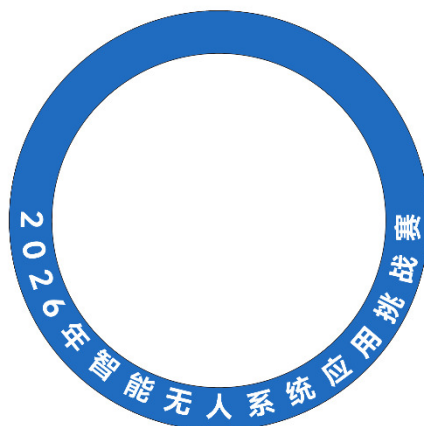
图2 救援区域和危险区域标识的外周圆环样式（示例）