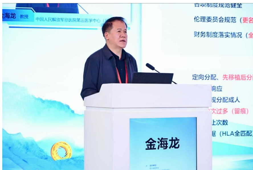
中国人民解放军总医院第三医学中心（北京）金海龙教授

除主会场外，大会精心设置多个分会场，邀请众多知名专家学者进行主题演讲，举办系列精彩讲座与深度研讨活动，为参会者搭建了与行业领军人物面对面交流的优质平台。