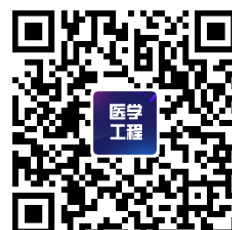
本次会议预约报名