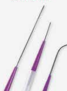
导丝 Bard Guidewires