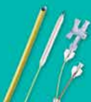
肾造瘘球囊扩张导管 X-Force N30 Nephrostomy Balloon Dilation Catheter