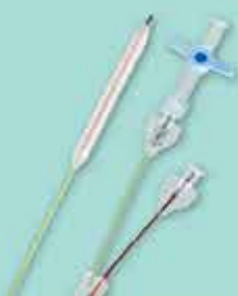
输尿管镜球囊扩张导管 X-Force U30 Ureteroscopic Balloon Dilation Catheter