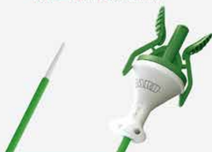
一次性使用无菌输尿管鞘 Proxis™ Ureteral Access Sheath