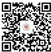
广西医学会公众号

（四）通知可登录广西医学会网站www.gxma.org.cn 下载（PDF 格式）及关注广西医学会微信公众号：guangxiyxh 和广西放射学分会微信公众号：gxfangshe 查询及下载。