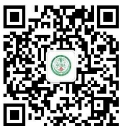
广东省医学会学术交流

有关会议最新消息欢迎浏览广东省医学会网站: www.gdma.cc 或关注微信公众平台。