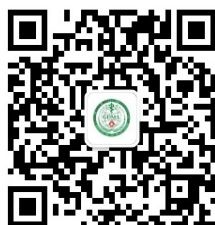
广东省医学会学术交流