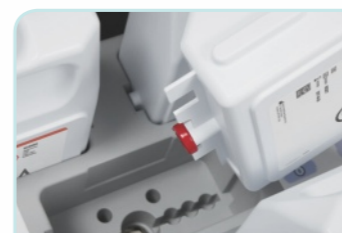
特色锯齿设计耗材瓶