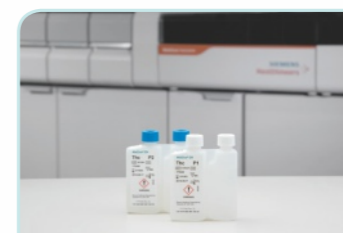
特色双仓试剂瓶设计