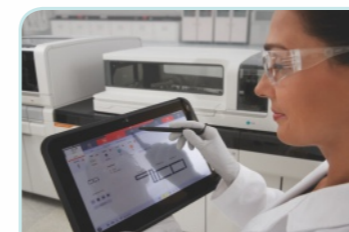
灵活多样的用户界面

西门子医疗新一代生化免疫解决方案-Atellica全自动生化免疫分析仪，基于用户导向和特色的设计理念，将为检验工作提供更好的样本掌控力，更便捷的检测流程以及更佳的结果。