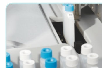
全自动试剂装载省时省力