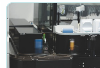
双向可变速磁动样本传输