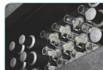
在线冰箱支持真正自动质控