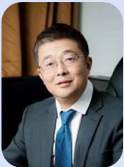
何 清 教授