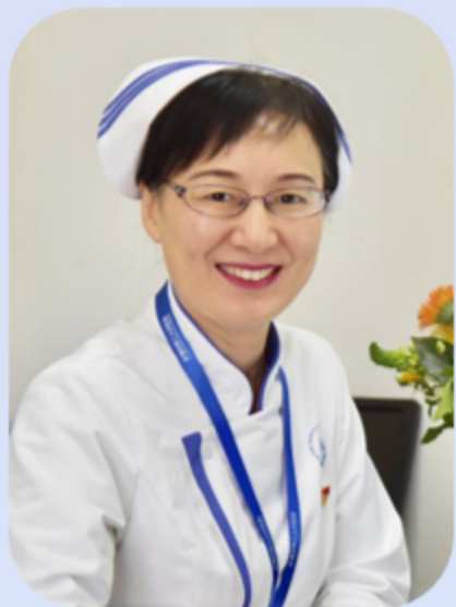
操 静 教授