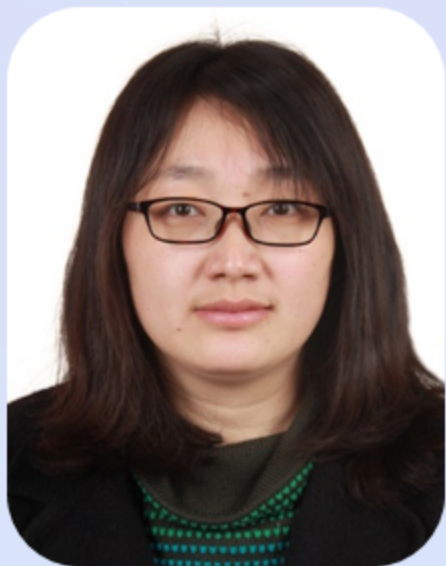
刘 巧 教授