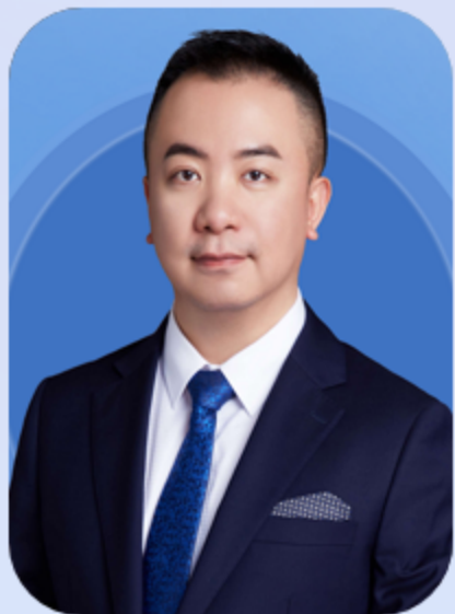
陈 愉 教授