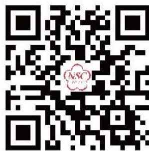
沉积学大会微官网