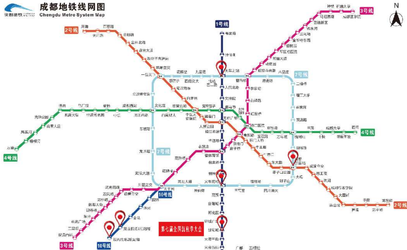
成都地铁线网图 Chengdu Metro System Map