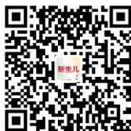
新生儿年会微官网