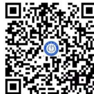
缴费二维码，打开支付宝[扫一扫]

为充分保证学员学习效果，本次培训班线下参会招生限额 200 人，招满即止。谢绝现场报名。