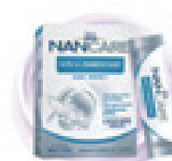
HMO补充剂 (跨境电商产品)