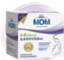
GOMER粉剂 (跨境电商产品)