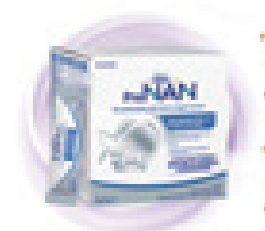
母乳营养补充剂 (跨境电商产品)