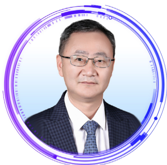
吴浩教授 首都医科大学