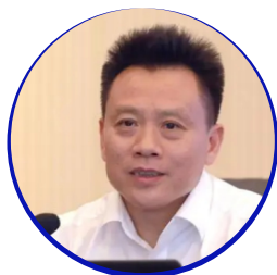
虞先国 教授 四川轻化工大学校长

虞先国，博士，教授，博士生导师。现任四川轻化工大学校长，国家杰出青年科学基金获得者、中国青年科技奖获得者、“新世纪百千万人才工程”国家级人选、四川省学术和技术带头人、教育部首批“新世纪优秀人才支持计划”人选、享受国务院政府特殊津贴，曾获“地质金锤奖”、“侯德封矿物岩石地球化学青年科学家奖”称号。主持国家自然科学基金重大科研仪器设备研制专项、科技部重大科研仪器设备专项、国家杰出青年科学基金、国家863计划项目、国防科工局重大专项。