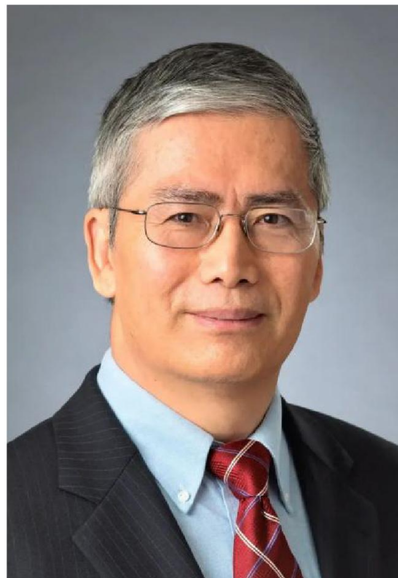
宋春山教授 PROF.CHUNSHAN SONG