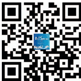
(会议微官网二维码)