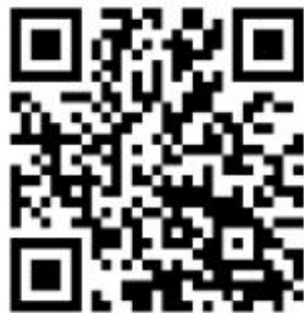
2026 年高压氧新从业人员 培训报名及付款码